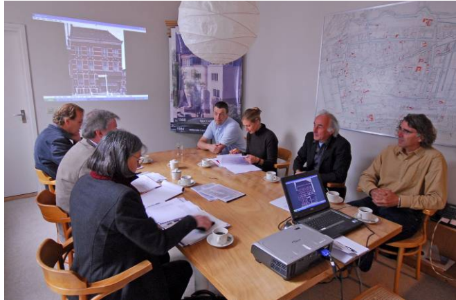
Externe beoordeling van een restauratie-architectenbureau in het kader van de GEAR door een multi-disciplinair team van specialisten.

De beoordeling wordt in de regel uitgevoerd door een multidisciplinair team, waarin de specialismen op het terrein van het beoordeelde vakgebied, de restauratie-expertise, certificering en bedrijfsvoering vertegenwoordigd zijn. Het team neemt gezamenlijk beslissingen over de vraag of een bedrijf/bureau voldoet aan de eisen die de erkenningsregeling stelt.