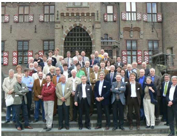
Restauratie-architecten bijeen op kasteel De Haar, op weg naar erkenning conform een eigen kwaliteits-erkenningsregeling (GEAR) mei 2006.

Een terugtrekende overheid in verschillende maatschappelijke sectoren waarin inhoudelijke kwaliteit centraal staat, heeft er toe geleid dat er door meerdere branches in de markt initiatieven zijn ontplooid en uitgewerkt om te komen tot eigen erkenningsregelingen of kwaliteitskaders. Ook in de Nederlandse monumentenzorg en restauratie speelt dit en bij meerdere daarin opererende branches zijn op die manier specifieke erkenningsregelingen tot stand gekomen en in voorbereiding. Hoewel deze regelingen qua aard, historische achtergrond en ontwikkelingsfase uiteenlopen, is er een aantal gemeenschappelijke kenmerken. Die gezamenlijke kenmerken betreffen vooral het doel van de erkenningen.