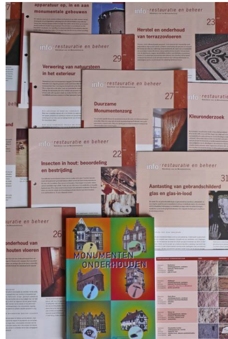
Kennisdocumenten van de RACM en andere organisaties helpen bij kwaliteitsnormering