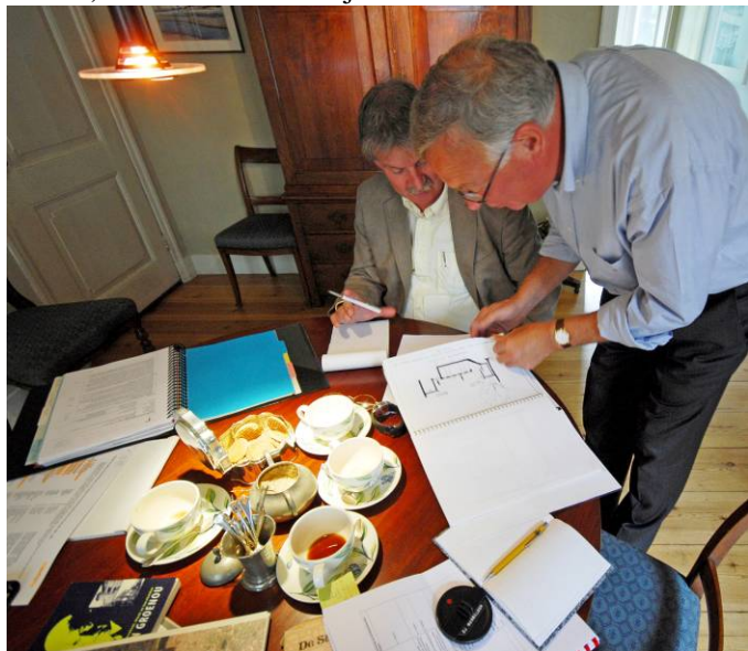
Toets op bedrijfsvoeringsaspecten bij een toetrendend architectenbureau in het kader van de GEAR

In andere sectoren hebben bedrijven of bureaus (soms bewust) niet gekozen voor ISO-certificering; in dat geval worden ze ook op deze ISO-aspecten beoordeeld. Algemeen kenmerk van de restauratiespecifieke erkenningsregelingen is dat ze in vergelijking met de ISO-9001 norm minder bureaucratische eisen stellen ten aanzien van de bedrijfsvoeringsaspecten en meer rekening houden met schaalgrootte en cultuur van de organisatie. Primair mikken de restauratiespecifieke regelingen uiteraard op de kwaliteit van het door de bedrijven geleverde werk aan het gebouwde erfgoed.