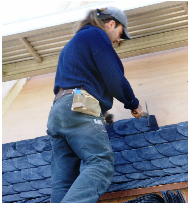
Uitvoeringskwaliteit is goed objectief te beoordelen. Leidekkerswerk door erkende restauratieleidekkersbedrijven is daarvan een voorbeeld.

In geval van bezwaren en beroep tegen een afgegeven beoordeling is er een formeel traject via het erkenningsinstituut, waaraan een College van Advies is verbonden dat beroepszaken kan behandelen.