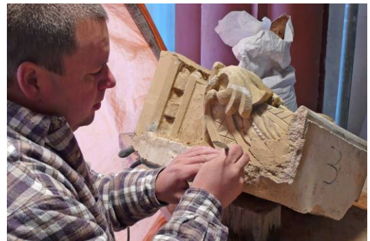
De kwaliteit van de restauratieketen als geheel is cruciaal. Architecten, aannemers, onderaannemers en specialisten waarborgen samen die kwaliteit.

In toenemende mate is kwaliteitsborging in de restauratieketen als geheel van belang. Aan die ambitie wordt vormgegeven door de verschillende uitvoeringsbranches tot een vorm van erkenning en kwaliteitsborging te brengen. De respectievelijke erkenningen moeten daarbij onderling zijn afgestemd, zodanig dat elke partij in staat wordt gesteld aan de eigen kwaliteitsnorm te voldoen op een wijze die de normering van de andere spelers eveneens realiseerbaar maakt. De architect wordt in dat verband beoordeeld op de vraag of hij de hoofdaannemer op kwaliteit heeft geselecteerd, aanstuurt en beoordeelt, de hoofdaannemer op dezelfde wijze in de richting van de architect en van de onderaannemers.